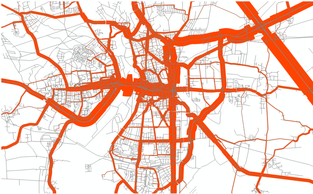
Verkehrsbelastung KFZ in Tageswerten